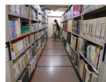
5月9日(土) 探検! 閉架書庫