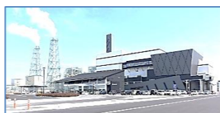
〈知多南部広域環境センター ゆめくりん〉

申込み: 6月6日(土)から 窓口受付 9:00~ 電話受付 10:00~(初日のみ)